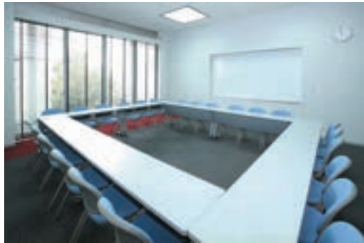
第1～3会議室 (定員 24 名)