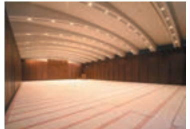
多目的ホール (フラット)