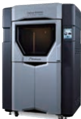
熱溶解樹脂押し出し積層造形機

新製品開発に欠かせない試験・検査機器を数多く備え、様々な試験・分析に対応します。また専門スタッフが技術的な相談に応じるほか、測定・試験を受託いたします。(受託試験には公的証明書を発行いたします)