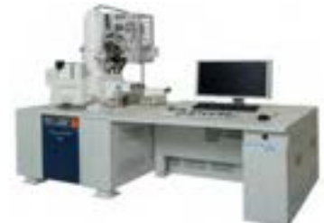
走査型電子顕微鏡