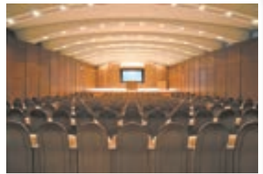
多目的ホール (椅子 209 席)

会議・研修・展示会、女性の趣味の会、サークル活動、カルチャースクールやコンサートなど、幅広くお使いいただけます。