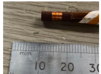
磁化測定プローブ