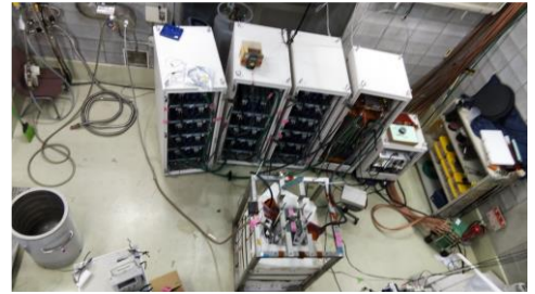
可搬式磁場発生システム

研究を進める上で課題となっている各種加工技術等について企業の皆さまにお助けいただきたく、当日は詳細をご説明します。一緒に研究を発展させていきましょう。