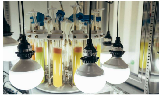
図: 藻類の培養試験の様子