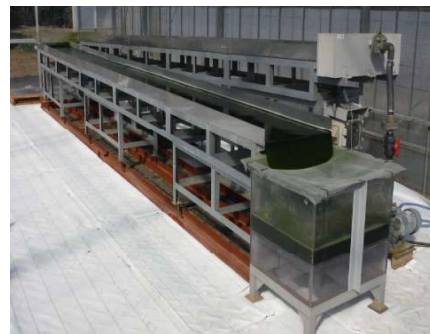
図: 藻類培養技術センター 農業用温室内に設置した藻類大量培養装置

事業拡大に向けて2019年4月に柏市内に「藻類培養技術センター」を開所しました。微細藻類の大量培養は屋外でも可能であり、将来は耕作放棄地等を活用した藻類工場を展開したいと考えています。