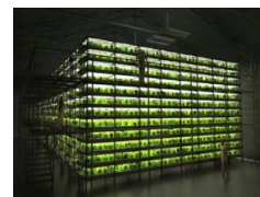
大規模植物工場イメージ

図に示すような大型植物工場(顧客要求規模でカスタマイズ可能)を販売する。また常に栽培をモニタリングして適切な助言を行う。