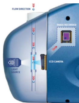
粒子画像解析装置 解析部分