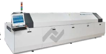
リフローはんだ付け装置