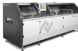
局所噴流はんだ付け装置